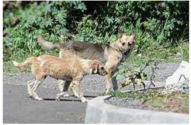
Chiens en divagation