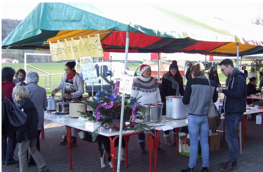
Le comité des fêtes.

Faire tremper les pois cassés au moins 30 min, faire revenir les échalotes dans l'huile d'olive, faire cuire les pois cassés et pommes de terre en même temps à feu moyen, ensuite rajouter les échalotes, poivre et sel. En fin de cuisson, mixer l'ensemble et rajouter la crème fraîche.