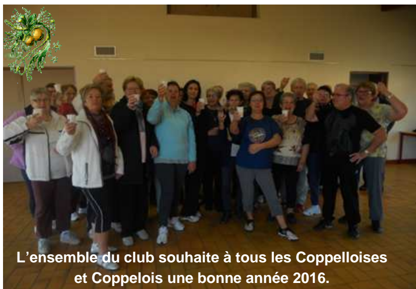
L'ensemble du club souhaite à tous les Coppelloises et Coppelois une bonne année 2016.

En 2015, la participation à notre marche pour le Téléthon (organisé par Télédome), a permis de parcourir 9kms avec plus de 60 marcheurs et la somme récoltée a été d'un montant de 452 euros. Merci à tous.