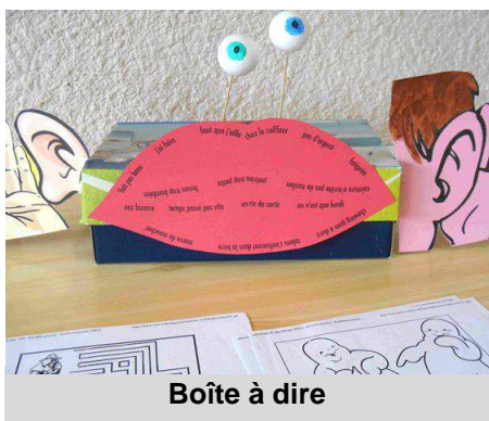
Boîte à dire

Les élèves des classes de Céline et Nicole ont participé au raconte tapis sur le thème du cirque organisé par la communauté de communes et animé par les bénévoles de la bibliothèque. Les enfants ont apprécié le kamishibai (théâtre d'images japonais).