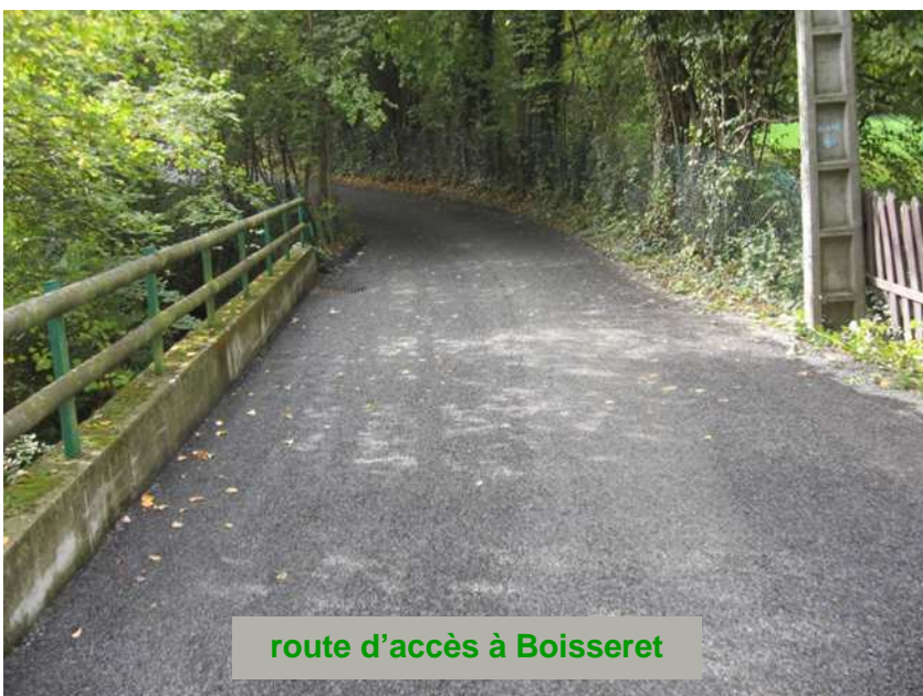
route d'accès à Boisseret