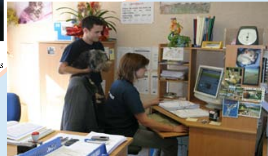
Recherche approfondie des propriétaires et restitution des animaux