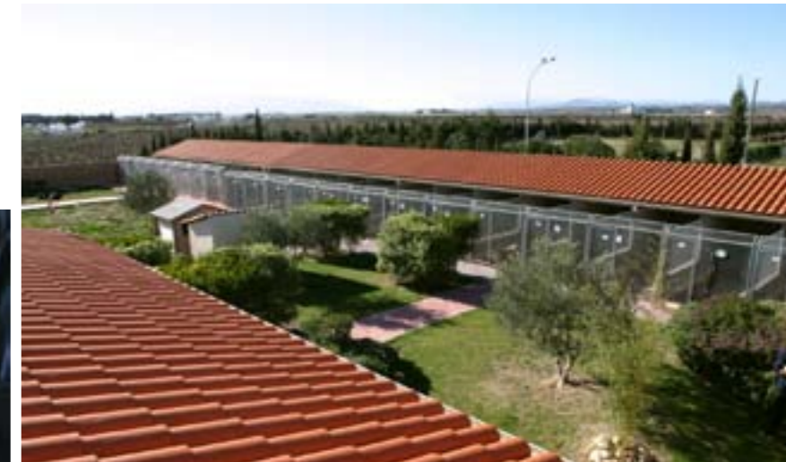
Vaccination et identification systématique (tatouage ou puce électronique)