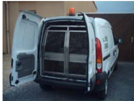
Interventions 24/24 et 365 jours par an. Matériel adapté. Prise en charge des chiens dits dangereux